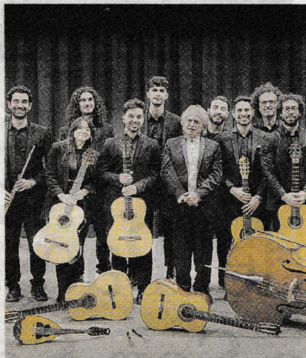
MUSICISTI L'Orchestra De Falla